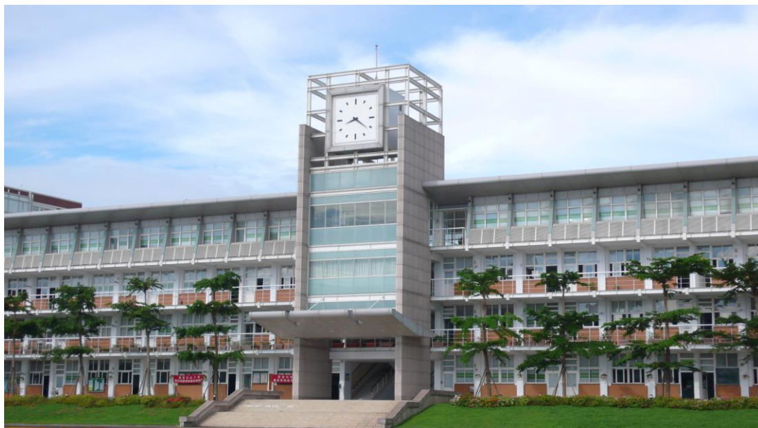
圖 3-5 嶺東科技大學春安校區